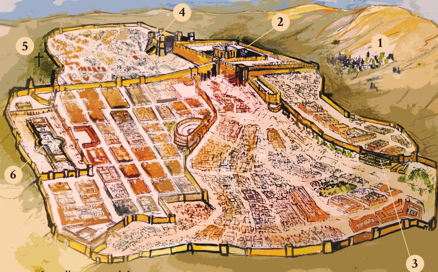
Jerozolima w czasach Jezusa