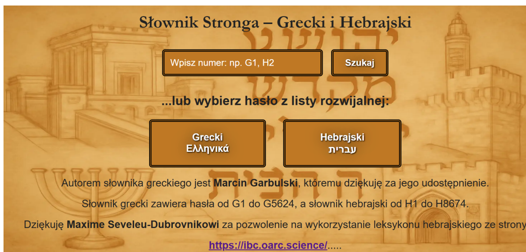
Ryc. 4. Słownik i wyszukiwarka Stronga dostępna na portalu

Integralną częścią portalu jest słownik Stronga (ryc. 4), obejmujący hasła greckie (od G1 do G5624) i hebrajskie (od H1 do H8674). Użytkownik może wpisać numer i uzyskać szczegółowe informacje o danym słowie, jego występowaniu i znaczeniu.