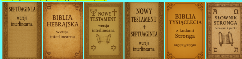
Ryc. 1. Strona główna portalu bibliaapologety.com

Kliknij na jedno z 6 zdjęć poniżej, aby przejść do danej wersji