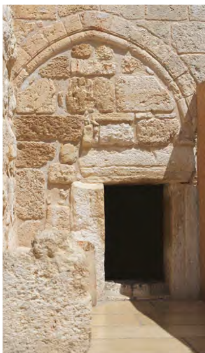
„Drzwi pokory” - wejście do Bazyliki Narodzenia w Betlejem

Tak właśnie o tym informuje nas św. Łukasz, pisząc: W owym czasie wyszło rozporządzenie Cezara Augusta, żeby przeprowadzić spis ludności w całym państwie. Pierwszy ten spis odbył się wówczas, gdy wielkorządcą